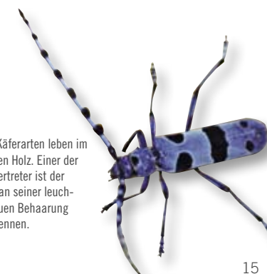
Über 1.300 Käferarten leben im und vom toten Holz. Einer der schönsten Vertreter ist der Alpenbock , an seiner leuchtend hellblauen Behaarung leicht zu erkennen.