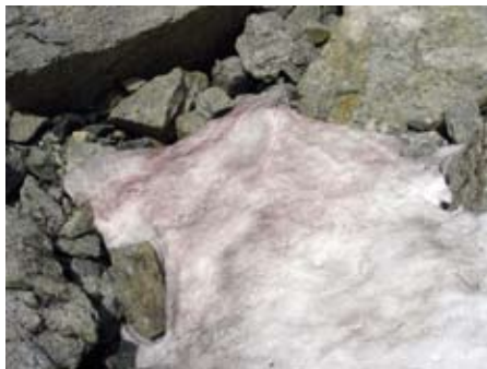
Im Frühsommer besiedeln Schneevalgen die schneebedeckte Fläche des Gletschers. Pigmente dienen als Schutz vor der starken UV-Strahlung und führen zu einer Rotfärbung des Schnees.

Ebenfalls mikroskopisch klein sind die Schneevalgen , die bei günstigen Umweltbedingungen – viel winterlicher Schneefall und langsames sommerliches Abschmelzen – eine Rotfärbung des Gletschers bewirken („Roter Schnee“). Von ihnen ernährt sich der nur wenige Millimeter groß werdende Gletscherfloh aus der Gruppe der Springschwänze.