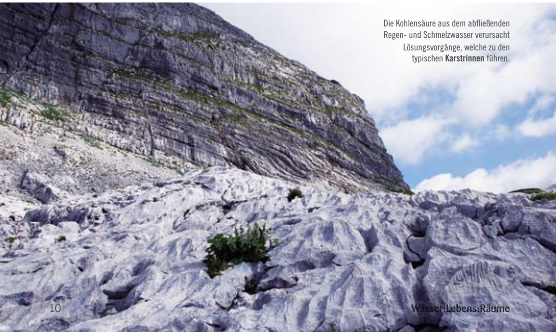
Die Kohlensäure aus dem abfließenden Regen- und Schmelzwasser verursacht Lösungsvorgänge, welche zu den typischen Karstrinnen führen.