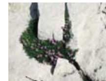
Das Stengellose Leimkraut ( Silene acaulis ) – auch als Polsternelke bezeichnet – wächst auf Felsen und in steinigem Magerrasen. Durch seinen Polsterwuchs erzeugt es ein eigenes Mikroklima und trotz so den extremen Bedingungen im Hochgebirge.

Im Winter leben Schneehühner auf Sparflamme und graben sich während der Nacht und auch tagsüber nach der Nahrungsaufnahme in Schneehöhlen ein, um Schutz vor Kälte und Fressfeinden zu finden. Eine Beunruhigung durch Freizeitsportler steigert den Energieverbrauch und kann zum Tod des Tieres führen.