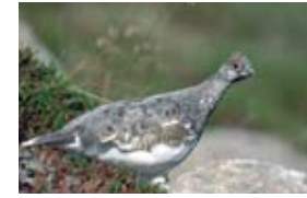
Das Alpenschneehuhn aus der Gruppe der Raufußhühner gehört zu den durch die europäische Vogelschutz-Richtlinie EU-weit besonders geschützten Tieren.

Auch das Alpenschneehuhn ist gut an das Leben im Hochgebirge angepasst. Die Färbung seines Gefieders wechselt im Jahresverlauf: Im Winter ist es weiß gefärbt und in der verschneiten Landschaft perfekt getarnt. Im Sommer nimmt es eine grau-braune Färbung an und verschmilzt mit der alpinen Felslandschaft.