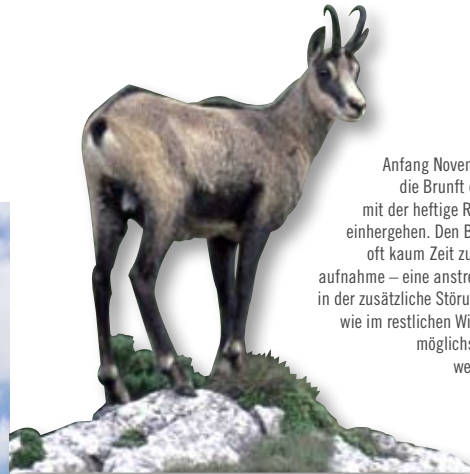
Anfang November beginnt die Brunft der Gämsen , mit der heftige Revierkämpfe einhergehen. Den Böcken bleibt oft kaum Zeit zur Nahrungsaufnahme – eine anstrengende Zeit in der zusätzliche Störungen ebenso wie im restlichen Winterhalbjahr möglichst vermieden werden sollten.

Trotz der oft lebensfeindlichen Bedingungen sind die Karstgebirge Heimat zahlreicher, teils gefährdeter Arten. Perfekt an die Fortbewegung auf Fels, Eis und Schnee angepasst sind die Gämsen : Ihre Hufe schmiegen sich mit der weichen Sohle an den Untergrund an und sorgen so für die nötige Bodenhaftung. Höhenstufen von bis zu zwei Metern sowie mehrere Meter breite Klüfte und Spalten werden mühelos im Sprung überwunden. Im Winter ziehen sich die Gämsen auf der Suche nach Äsungsflächen auf schneearme Südhänge und Grate und in tiefere Lagen zurück. Auf Störungen – etwa durch Schitourengeher – reagieren die nun oft ohnehin geschwächten Tiere besonders empfindlich.