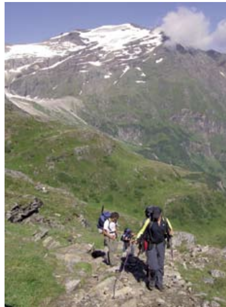
Unterwegs zum Gletscherlehrpfad.

Der im Nationalpark Hohe Tauern gelegene Gletscherlehrpfad der Naturfreunde rund um das Goldbergkees informiert mit Schautafeln und einem Folder über den Gletscher und seine Entwicklung sowie über aktuelle Forschungsergebnisse zu Gletscher und Klima.