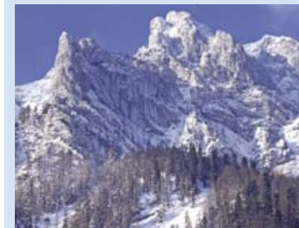
Im Winter stabilisieren Bergwälder die Schneedecke und schützen so vor Lawinen.

Wichtig für die Schutzwirkung der Wälder ist eine naturnahe Zusammensetzung der Baumarten. So halten beispielsweise Bestände, in denen auch einige tiefwurzelnde Tannen wachsen, Stürmen besser Stand als reine Fichtenwälder. Manche Laubbaum-Arten wie beispielsweise der Bergahorn können wiederum auch auf sehr lockerem Untergrund wie Geröllhalden wurzeln, wo sie den Boden stabilisieren.