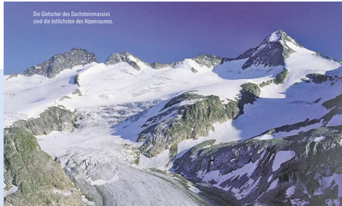
Die Gletscher des Dachsteinmassivs sind die östlichsten des Alpenraumes.

Gletscher haben als Wasserspeicher eine wichtige ökologische Funktion, sind doch drei Viertel der weltweiten Süßwasserreserven in Eis und Schnee gebunden. Sie sind bedeutende Wasserzulieferer für unsere Alpenflüsse und helfen zugleich Hochwasserspitzen zu dämpfen, indem sie die reichlichen Niederschläge der Wintermonate in fester Form zurückhalten und in den niederschlagsärmeren Sommermonaten als Schmelzwasser freisetzen. Zudem stabilisiert das Gletschereis die Fels- und Schuttmassen des Hochgebirges.