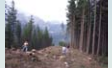
Die neuangelegte Schneise für die Tourengänger.

Durch diese Maßnahmen konnte eine Entwicklung in Richtung nachhaltige Naturraumnutzung gewährleistet und zur Freude aller Beteiligten umgesetzt werden.