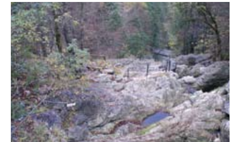
Der „Hallstätter Gletschergarten“ mit seinen von den ehemaligen Gletschern geprägten „Gletschertöpfen“ kann vom Natura Trail Dachstein aus besichtigt werden.

Der Natura Trail führt von Hallstatt durch das malerische Echerntal auf das Dachstein-plateau und gewährt einen beeindruckenden Einblick in die von Gletschern geprägte Landschaft mit ihren U-förmigen Trogtälern, Seen und der heute noch vorhandenen Vergletscherung in der Gipfelregion.