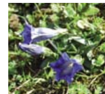
Auf Fels- und Geröllfluren sowie Kalkmagerrasen wächst der Kalk-Glockenzian ( Gentiana clusii ), der in Österreich unter Naturschutz steht.