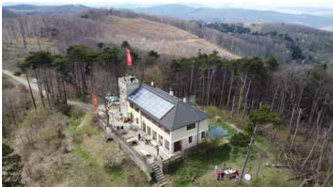
Das Höllensteinhaus und Umgebung

Treffpunkt/Abfahrt: 9:00 Uhr, Bahnhof Meidling, Kartenautomaten Abfahrt: 9:19 Uhr | Ankunft: 10:15 Uhr, Sittendorf