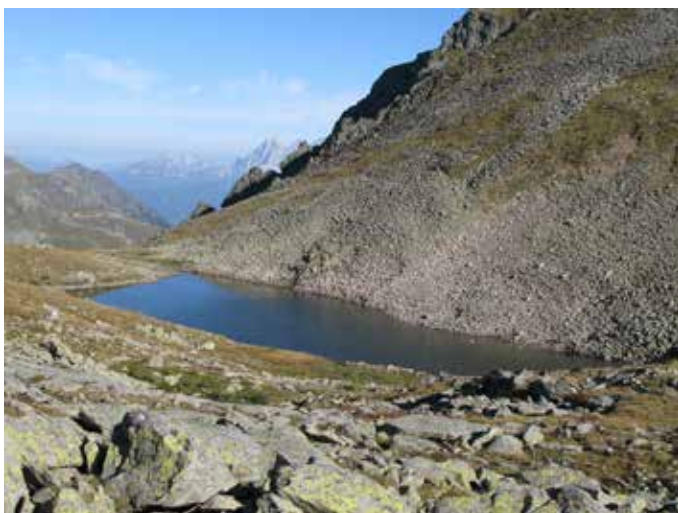
Der Klafferkessel

Diese Tour setzt alpine Erfahrung voraus, zumal sie zwischen Gollinghütte und Preintalerhütte anspruchsvoll ist. Trittsicherheit und Schwindelfreiheit sind für diesen Abschnitt Voraussetzung. Meiner Meinung nach sollte die Tour nicht mit Kindern begangen werden. Ebenso ist das Wetter im Auge zu behalten, zumal die Tour bei schönem Wetter traumhafte Ausblicke und ein Seenparadies verspricht. Ich rate davon ab, die Tour bei Nässe, Nebel und Gewitter zu gehen. Natürlich kann die beschriebene Runde in beide Richtungen begangen werden. Da alpine Steige erwartet werden, ist sie für Mountainbiker*innen nicht geeignet. Für Gipfelsammler*innen ist die Gollinghütte ein ideales Basislager für die Besteigung des Hochgollings.