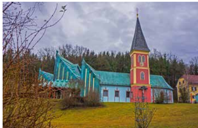
Thalkirche von Fuchs

In der Saison 2024 steht bei den Opernfestspielen im Römersteinbruch St. Margarethen AIDA von Giuseppe Verdi auf dem Spielplan. Einer unserer Naturfreunde-Gruppen möchten wir es