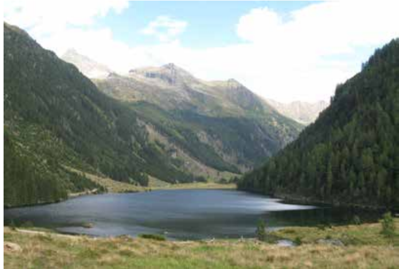
Der Riesachsee

Die Wasserfälle werden nach dem Start nicht besucht, es geht die Forststraße entlang bis zum Talende. Bei der Talstation einer Materialseilbahn beginnt der Aufstieg auf einem Pfad zur Gollinghütte auf 1.643 Metern. Diese Hütte eignet sich ausgezeichnet für die Übernachtung, doch sollte unbedingt ein Schlafplatz reserviert werden, da sie bei schönem Wetter sehr gut besucht ist. Am nächsten Tag geht es am Morgen gut ausgeschlafen steil bergauf bis zum Sattelsee auf 2.450 Metern. Ein Blick in den Norden lohnt sich beim Aufstieg, ist doch der höchste Berg von Oberösterreich, der Dachstein, zu sehen. Nach 800 Höhenmetern lädt dieser erste Bergsee zu einer kleinen Rast ein. Der Weg steigt jedoch weiter steil bergan auf den Greifenberg mit seinen 2.618 Metern. Hier gibt es einen traumhaften Ausblick auf den – für einige Steirer*innen – höchsten Berg des grünen Bundeslandes, da er nicht mit einem anderen Bundesland geteilt werden muss: den Hochgolling mit 2.862 Metern.