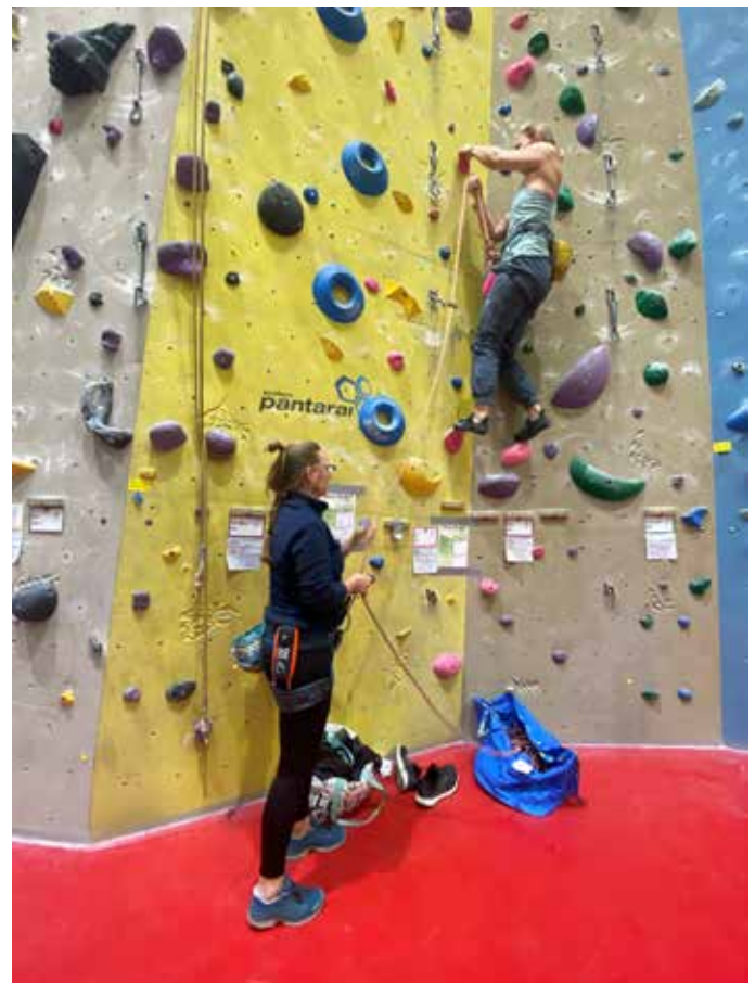
Klettertreff von Frauen für Frauen

Infos & Anmeldung: penzing.naturfreunde.at