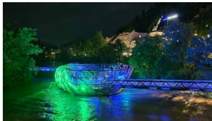
Die Murinsel bei Nacht

Kaum waren wir im Hotel angekommen, begann ein Gewitter mit mehrstündigem Starkregen. Für 22 Uhr hatten wir einen Gang zur beleuchteten Murinsel geplant – und wie auf Wunsch endete der Regen um 21:30 Uhr. So gingen wir zu dritt noch in die nächtliche Stadt. Die Luft war sehr angenehm und die Gesteine reingewaschen.