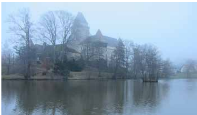
Schloß Heidenreichstein

Das südwestliche Waldviertel bietet mit dem Peilstein und der Ysperklamm die ersten Höhepunkte. Nördlich vom westlichsten Punkt von diesem Teil des Weges bei Harmanschlag muss mit dem Nebelstein noch ein letztes Mal ein 1.000 Meter hoher Berg erklommen werden. Den langen Abschluss im Waldviertel schmücken mit Weitra, Gmünd, Heidenreichstein, Waidhofen an der Thaya und Dobersberg nette größere Kleinstädte eine der kältesten Gegenden von Österreich.