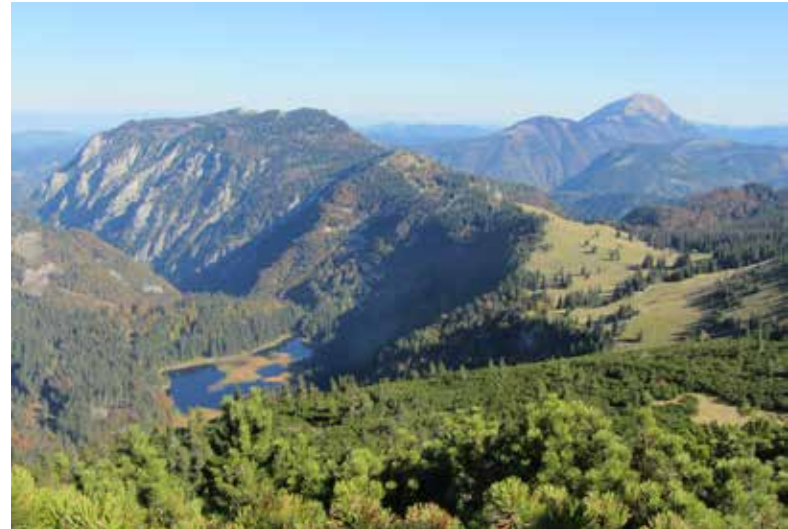
Ötscher und Obersee beim Dürrenstein

Bis zur Donau geht es jetzt die March entlang. Österreichische Geschichte in Jedenspeigen, aber auch bei den Marchfeldschlössern Marchegg und Schloss Hof, begleiten die Weitwandernden. Auch am Ende dieses Abschnittes empfehle ich einen Sidestep zur Marchmündung in die Donau mit dem Ausblick auf die slowakische Burg Devín.