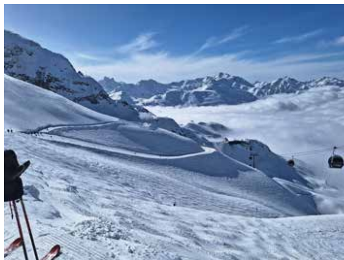
Beste Bedingungen am Skigebiet Arlberg

Die Firnwoche in Flirsch am Arlberg war ein voller Erfolg. Die hervorragende Unterkunft im Gasthof-Pension Grisseemann, das weltweit renommierte Skigebiet Arlberg, das perfekte Wetter und die kompetente Leitung durch Franz Kasal machten diese Woche zu einem unvergesslichen Erlebnis.