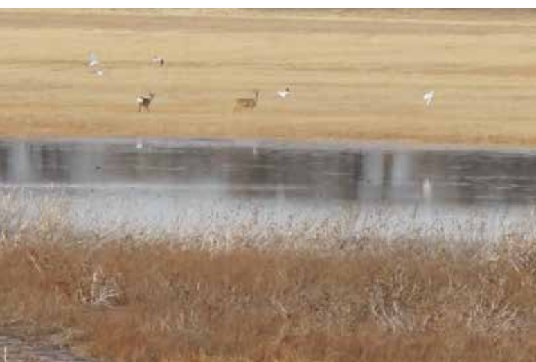
Rehe im Breitensee

Jetzt kommt ein einsamer Abschnitt durch die Türnitzer Alpen. Wer unbedingt Gipfelerlebnisse konsumieren will, kann eine anstrengende Tour über Gippel und Göller wählen. Der Normalweg führt über Sankt Aegydy und Gscheid ins Mariazellerland. Nach Mitterbach am Erlaufsee muss man über den Dürrenstein, um ins Ybbstal zu kommen. Es ist wieder ein anstrengender Abschnitt, aber ich freue mich jedes Mal über diesen wunderschönen Gebirgsstock, der zu meinen Lieblingsbergen zählt.