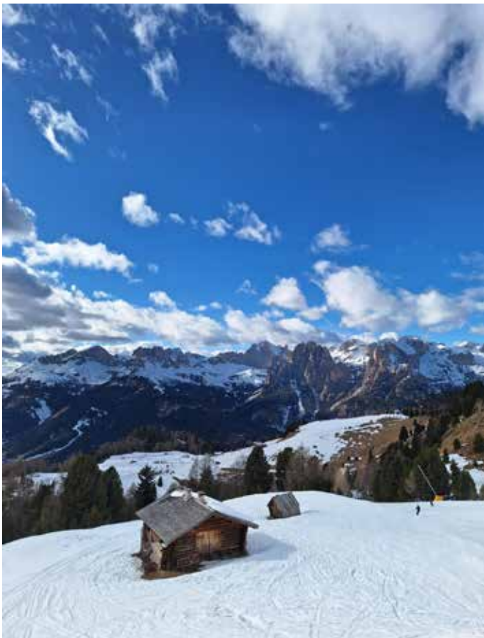
Bestes Skiwetter im Gebiet Sellaronda

Die Anreise über den Brenner verlief ohne Stau und wir erreichten das Park Hotel Mater Dei in Pozza di Fassa am späten Nachmittag.